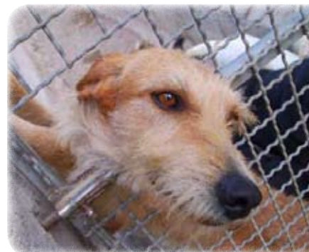
Ein freundlicher kleiner Hund wie dieser (unten) müsste in Deutschland nicht lange auf ein Zuhause warten. Hier ist er einer von über 700!

Luigi genießt die seltene Schmuseinheit und die Nähe zum Menschen.