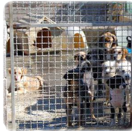
Pelle (unten) drängt sich dicht an den Zaun. Auch er möchte nicht übersehen werden.