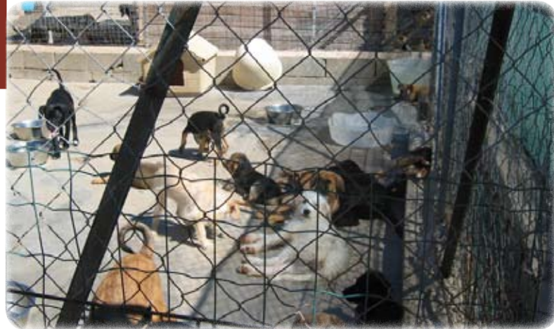
Die Junghunde im Gehege 1 - Sie wissen noch nicht, dass sie vielleicht ihr ganzes Leben im Refugio verbringen werden müssen!!